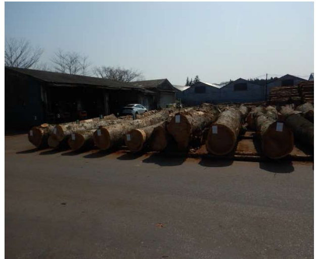
【令和5年度 春の特別市】